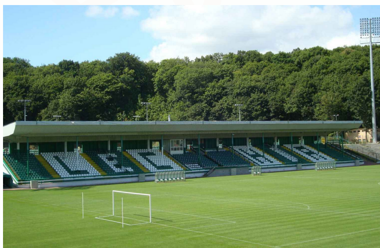
Kompleks piłkarski przy ul. Traugutta 29. Dwa pełnowymiarowe boiska naturalne

Jaguar Gdańsk serdecznie zaprasza na Międzynarodowy Turniej piłki nożnej chłopców i dziewcząt dla rocznika 2010, 2011, 2012, 2013 i 2014.