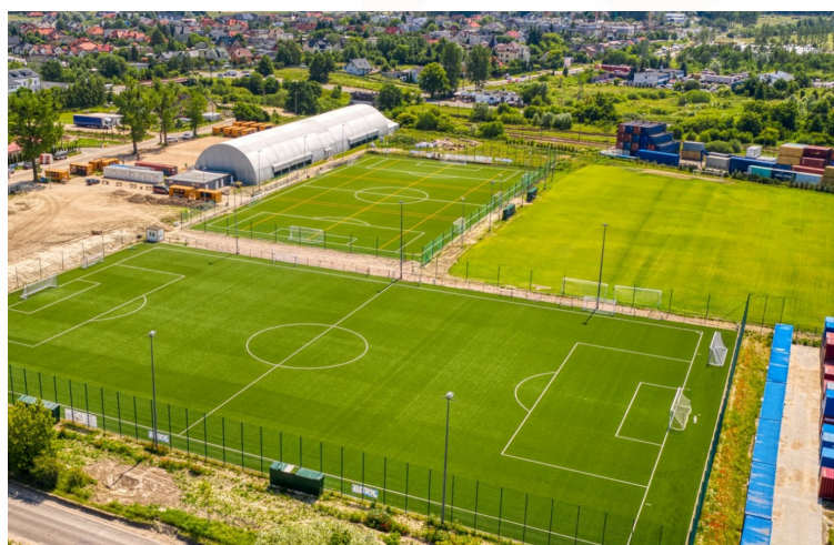
Kompleks piłkarski przy ulicy Budowlanych 49/5. Dwa pełnowymiarowe sztuczne i naturalne boisko